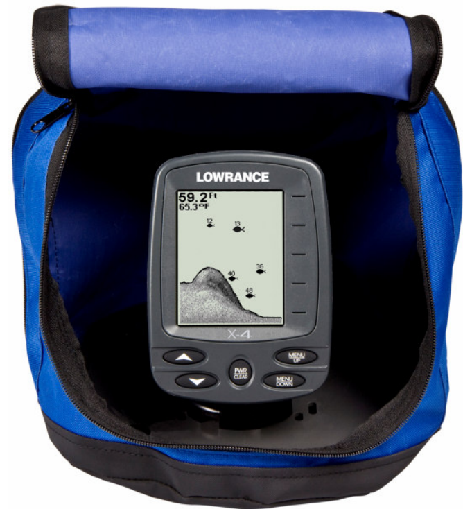
X-4 PT hordozható